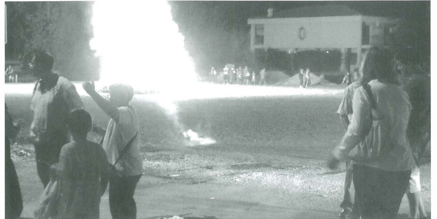
NIT DE SANT JOAN: foguerada, coca, moscatell i ballada de sardanes