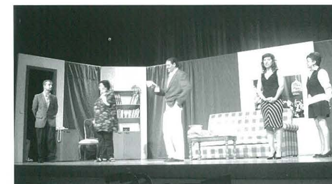
Representació de l'obra l'Estudiant Ros