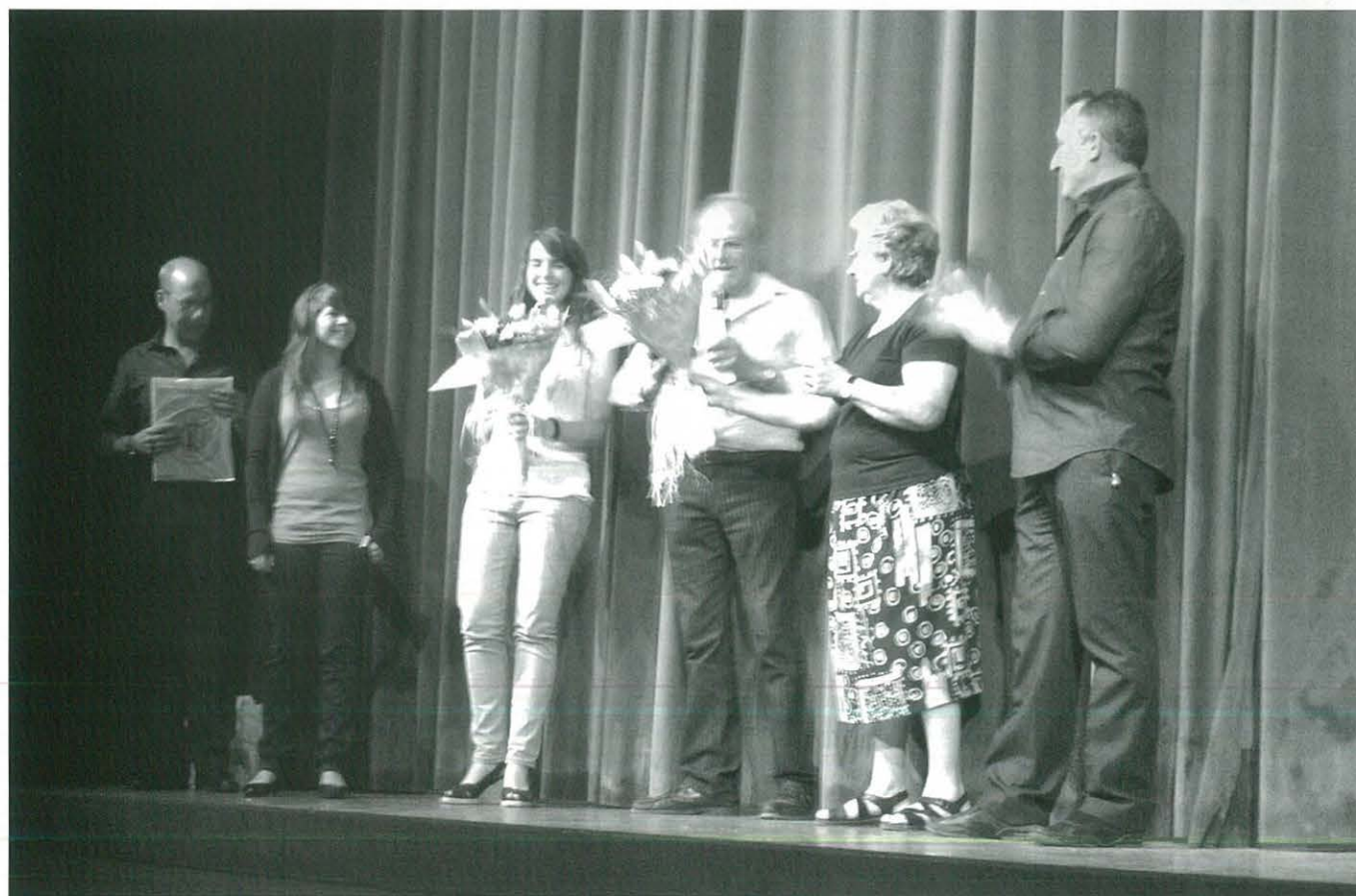
DIADA DEL SOCI: presentació i entrega del ram de flors a la Pubilla del 2009 i pubilla sortint.