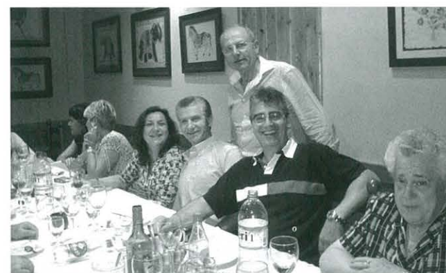
Sopar de germanor

hi trobareu una entrevista amb ella); per acabar l'acte es va representar l'obra "L'Estudiant Ros", del grup de teatre de la nostra entitat.