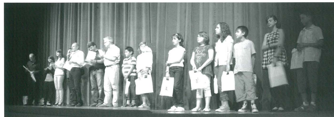
Lliurament de premis del Concurs Literari Sant Jordi